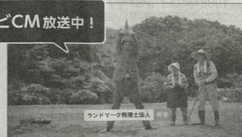
ランドマーク税理士法人