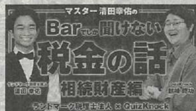
マスター清田の Barで聞けない税金の話 【相続財産編】

TV、ラジオ、書籍、新聞など、様々な媒体で情報を発信中! 詳細は、右の二次元コードをスキャン!