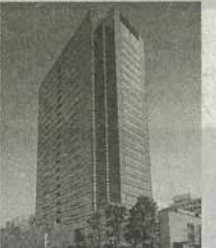
⑩ 武蔵小杉駅前事務所