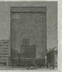
⑨ 銀洋新横浜駅前事務所