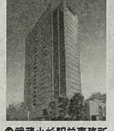
⑩武蔵小杉駅前事務所