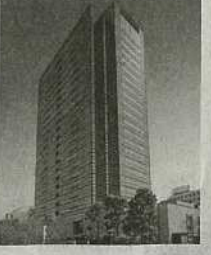
⑨ 武蔵小杉駅前事務所