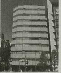
⑧ 新横浜駅前事務所