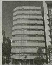
⑧新横浜駅前事務所