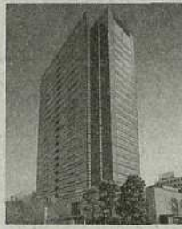
⑩武蔵小杉駅前事務所