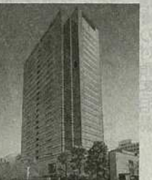
⑨ 武蔵小杉駅前事務所