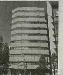
⑧ 新横浜駅前事務所