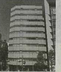
⑧新横浜駅前事務所