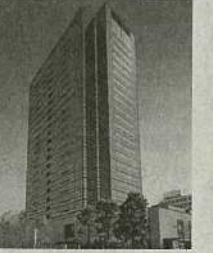
⑨武蔵小杉駅前事務所