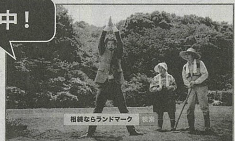
相続ならランドマーク