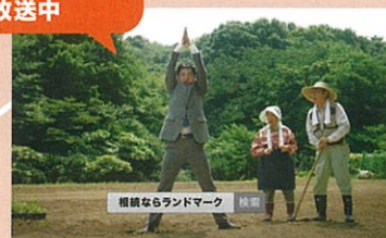
相続ならランドマーク 後援