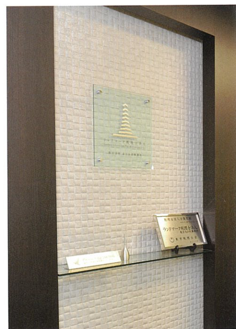
丸の内オフィスのエントランス

ランドマーク税理士法人・行政書士法人の各店舗に併設された「丸の内相続プラザ」は、相続の無料相談窓口。地方在住者には、北海道から福岡まで全国規模で業務提携する会計事務所などの紹介も行っています。