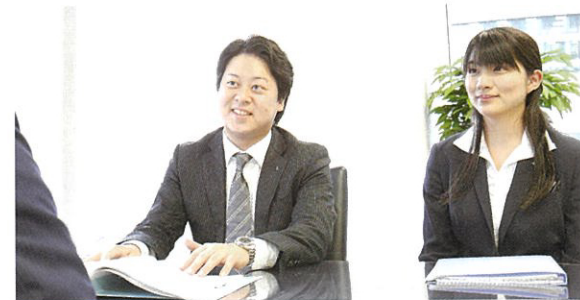
相談員が親身にお話を伺います

家のレベルアップを図るべく、実務講座『丸の内相続大学校』を開催するなど、人材の育成にも力を入れています（清田代表）。