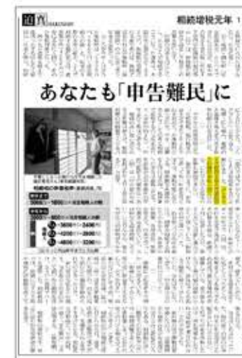
【日本経済新聞】 朝刊2面「迫真」 2015年12月2日