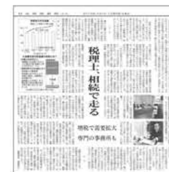
【日本経済新聞】 夕刊9面「税理士、相続で走る」 2015年12月9日