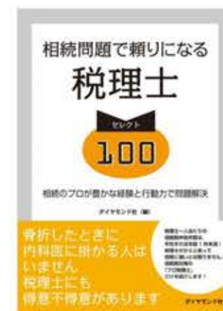
【ダイヤモンド社】 相続問題で頼りになる税理士100 2015年11月5日