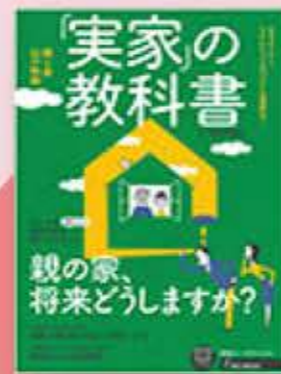
【リクルートMOOK】「実家」の教科書 2014年12月18日発行