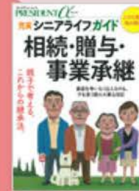
【プレジデントMOOK】相続・贈与・事業承継 2014年12月18日発行