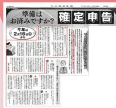
【日本農業新聞】14面「確定申告」 2015年1月29日発行