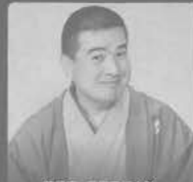
落語家 春風亭柳之助